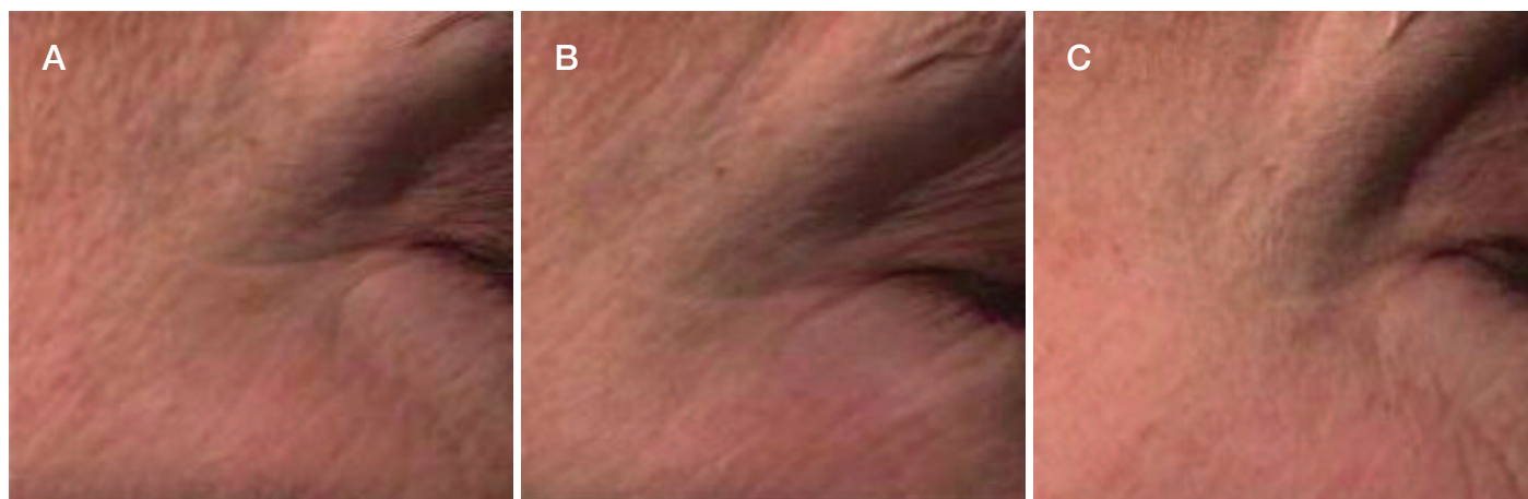
Figura 2. Foto ad alta definizione del volontario 16, al momento dell'inclusione (D1) (A) e a 29 giorni consecutivi d'uso del prodotto (D29) (B) e dopo 43 giorni consecutivi d'uso del prodotto (D43).

Immagine dell'area perioculare del volontario 16, al momento dell'inclusione (D1/T0).